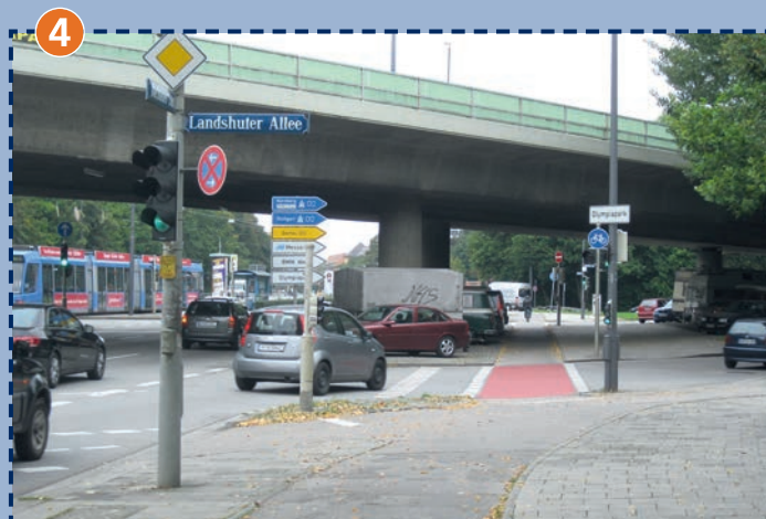
Kreuzung Dachauer Straße/Landshuter Allee